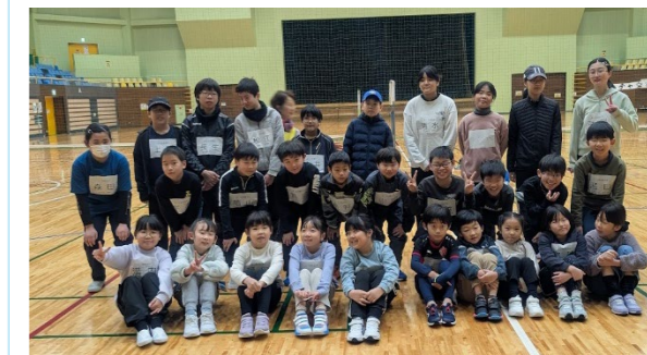
キッズテニス大会に参加したクラブメンバー。この中から世界チャンピオンが出て不思議ではない！