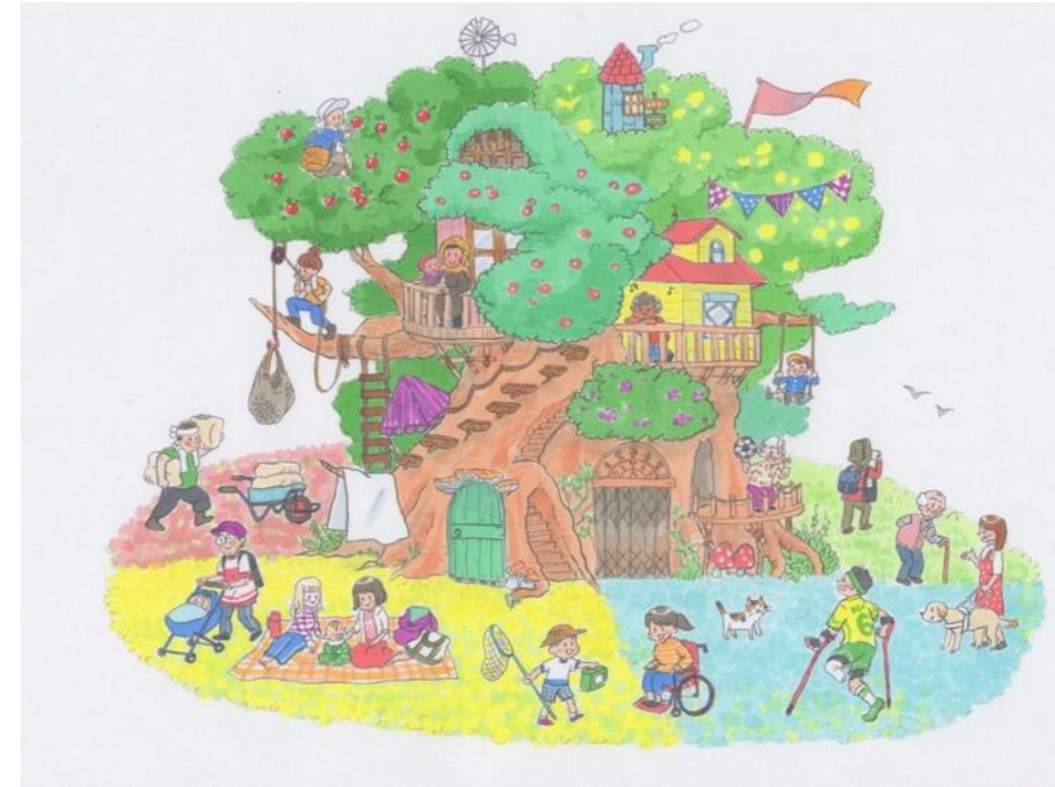
「インクルーシブフェスタ」 イメージイラスト 花咲マリサさん