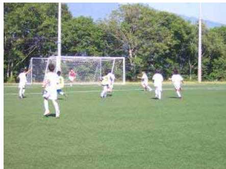
道祖土少年団との交流試合

道祖土少年団や少年団パパス（保護者や指導者）との交流戦、さらには、地元上田高校（今年のインターハイに出場されていました）のOBチーム六文銭との交流試合もあり、心地よい疲れの残る（ほんとは、一週間くらいあちこち痛かったです^^）合宿となりました。