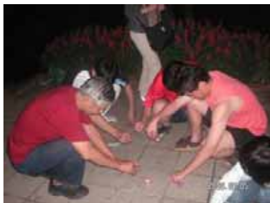
花火を楽しんでいるのは???

道祖土少年団や少年団パパス（保護者や指導者）との交流戦、さらには、地元上田高校（今年のインターハイに出場されていました）のOBチーム六文銭との交流試合もあり、心地よい疲れの残る（ほんとは、一週間くらいあちこち痛かったです^^）合宿となりました。