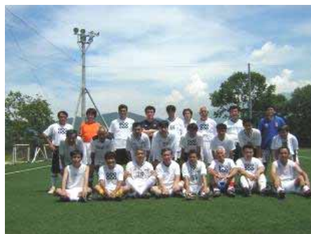
上田高校OBと生涯コース