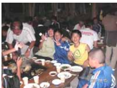
焼きそばを料理する監督と子ども達

また5～6日の1泊2日で、生涯コース（主にシニア）15名が合流し、5日の夜には、子どもも大人も一緒に楽しくBBQや花火大会に興じました。