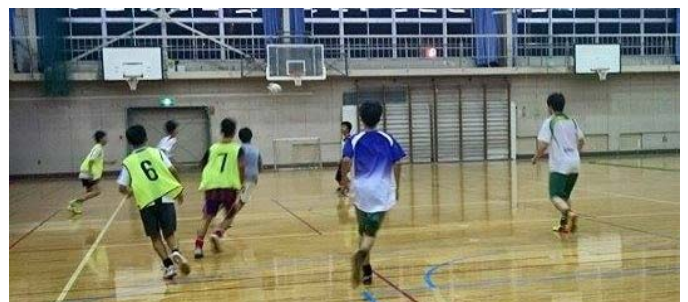
◇写真：中3生も参加するユースコース◇

特に部活を引退した中3生。週に1～2回身体を動かして受験勉強のストレス解消と高校に入っすぐに動ける故障しない体力・体調の維持のために。 現在4名の中3生が参加しています。