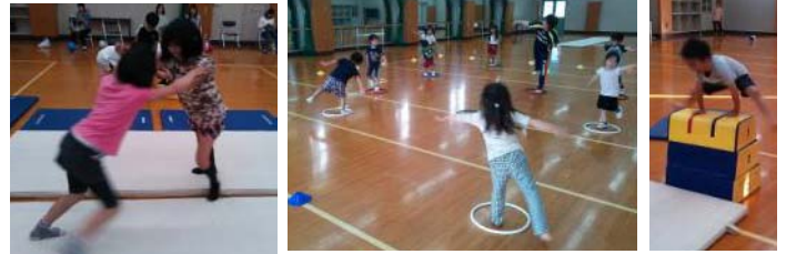
◆相撲・バランス・跳び箱◆