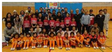
写真：2019年12月女子サッカー交流会を主催（ウラスポスーパーシニアに挑戦）

さいたま市内の中学生年代のサッカーチームは、レッズレディースU15、大宮FCエンジェルス、与野FCレディース、浦和ラッキーズFCの4つのクラブと原山中と常盤中の2中学校にしかありません。