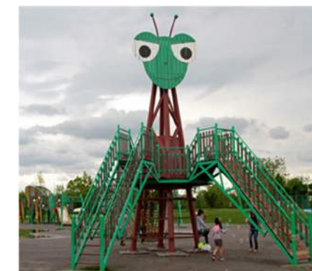
通常時の遊具は かなり大型のもの

富山県高岡市生まれ（高岡生まれなので高子と命名されました）、さいたま市（北区）在住。9月末までホットラウンジに勤務し定年退職。現在充電中…そろそろ満充電で活動再開か？（笑）