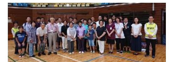
みんなの健康フェアも多くのボランティアで成り立っています