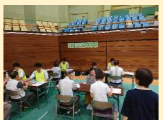
脳の健康チェック