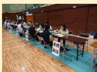
各種相談コーナー