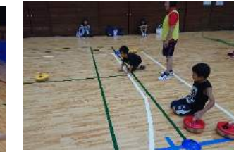
驚くほど進むフロアカーリング