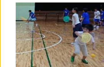
でのひらケットで楽しむスポーツ