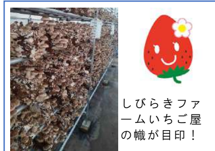
しびらきファームいちご屋の幟が目印！

地域の子供達達のスポーツ環境向上と一緒に取組んでいただける方、ご連絡ください！！