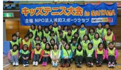
スタッフになると素敵なテニス仲間ができます！

会場整備、駐車場、受付などボランティアスタッフも大募集しています！地域デビューのきっかけに好きなテニスの大会のお手伝いからいかがですか！？