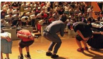
◆会場全員でポーズ！◆