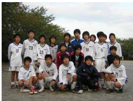
3年生の皆さん、ありがとう!