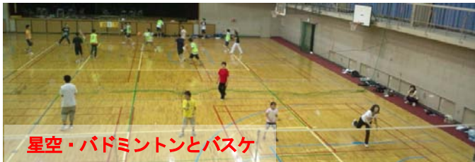
星空・バドミントンとバスケ