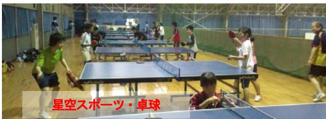
星空スポーツ・卓球